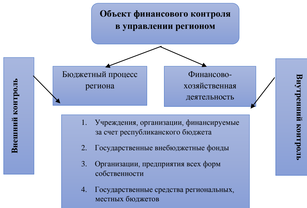
Рис. 1. Объекты финансового контроля в регионе

Обеспечение контрольных функций на региональном уровне в целом возлагается на органы исполнительной власти, в первую очередь на Счетную Палату. Этот вид контроля является правительственным и внутренним контролем ввиду того, что сами исполнительные органы проверяют подотчетные учреждения, предприятия, которые были финансированы в рамках бюджетного процесса за счет средств бюджетов разных уровней.