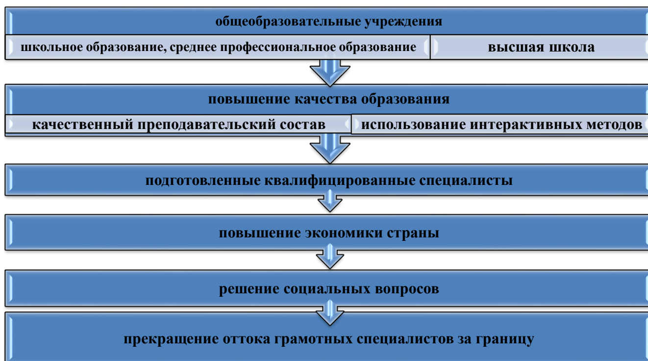
Рисунок 1. Влияние качественного образования

Все вышесказанное мы хотим воплотить в жизнь при помощи следующей схемы.