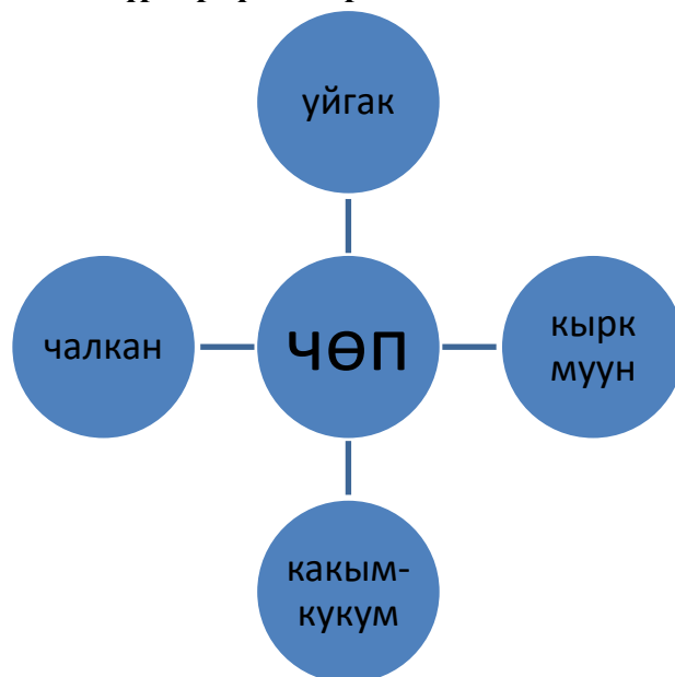
Схема 1. Гипонимиялык түрлөрдүн гетеронимдик жана согипонимдик катыштары

Чөп тек-гиперонимдик катышта жана гетеронимдик жактан өсүмдүк катыша алат, ал эми гипонимдер чалкан-уйгак- какым-кукум-кырк муун- дарычылык касиетине ээ болуп бири-бирине согипоним боло алышат.